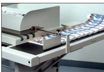
Reception of the books / Recepción de libros / Réception des ouvrages / Aufnahme der Büchern