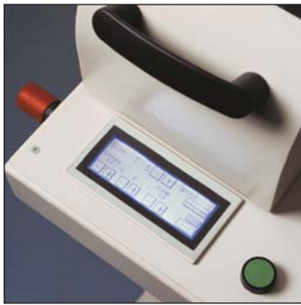
Easy to use touch screen Utilización fácil de la pantalla táctil Ecran de contrôle digital facile d'utilisation Einfache Touch-Screen-Steuerung